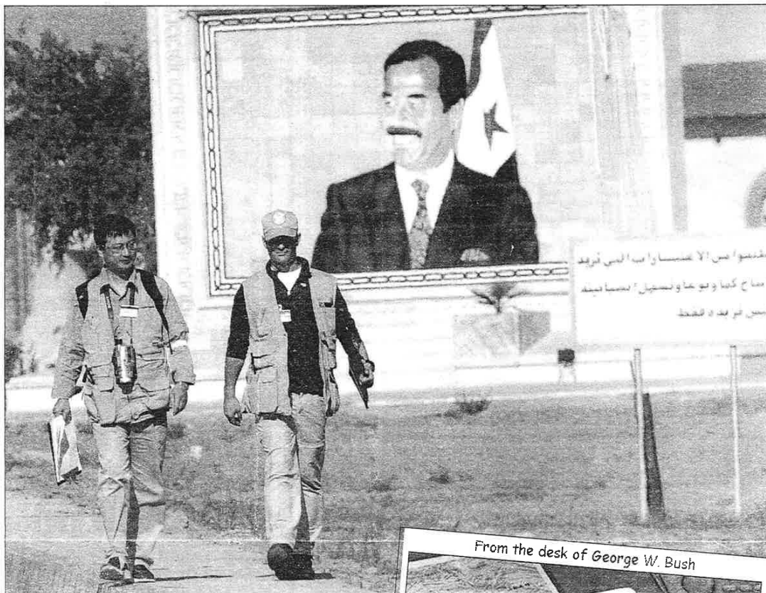
Våbeninspektørerne leder efter beviser i Irak.